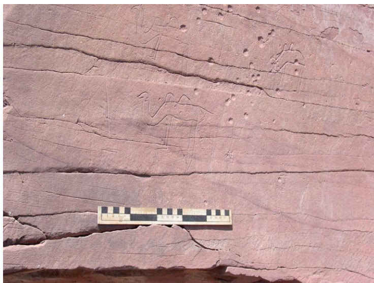
Рис. 1. Фото верблюда на горе Хашхай Fig. 1. Photo of a camel on Mount Khashkhai

Также С. П. Балдаевым записан обряд поклонения как горе, так и писанице в улусе Хашхай Унгинского ведомства Балаганского уезда Иркутской области в 1910 г., где жили буряты сартульского рода. На писанице, находящейся на горе Хашхай в долине реки Унги (левый приток Ангары), изображены сцены из жизни жителей долины. Нарисованы охотники, повседневный быт людей. На следующем рисунке четко видны верблюды (рис. 1), как и на Шишкинских писаницах. Наличие верблюдов в Западном Прибайкалье подтверждается тем, что верблюды представлены на древних писаницах эпохи курыкан на Верхней Лене [Окладников, Запорожская, 1959, с. 115]. В Западной Бурятии до середины XX в. верблюды были распространены у балаганских и верхоленских бурят.