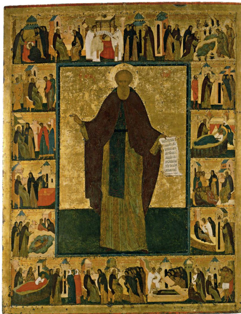
Рис. 1. Преп. Кирилл Белозерский с житием, начало XVI в.