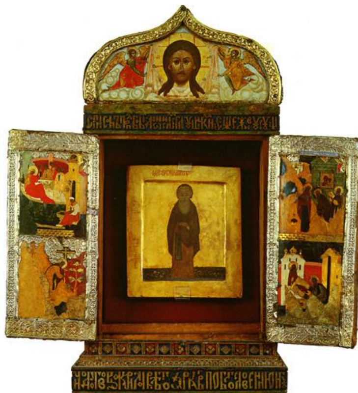
Рис. 2. Киот 1614 г. с иконой преп. Кирилла Белозерского Fig. 2. The icon case (1614) with the icon of St. Cyril Belozersky

Вновь обратимся к Житию Александра. В части сюжета его Жития, в которой развертываются события, связанные с основанием монастыря, в отличие от Жития Кирилла, насчитывается семь видений и чудо. Связанные между собой по смыслу видения вместе с чудом формируют символический план сюжета. Выстраивая в Житии духовный путь святого, Иродион показывает, что жизнь Александра окружена ореолом божественных чудес. С одной стороны, они знаменуют ключевые этапы духовного пути Александра, соотносящиеся с ситуациями ухода из дома в монастырь, из монастыря – в пустынь, выбора места поселения в пустыни, основание обители, и подчеркивают «ступенчатый» путь духовного восхождения инока. С другой стороны, содержание видений в сочинении поэтапно раскрывает и Высший замысел. Это может заметить внимательный читатель, но сам герой Жития, происходящих с ним чудес как будто не замечает и к основанию монастыря не стремится. (Согласно правилам аскетики, истинный подвижник не должен легко верить чудесам и знамениям, опасаясь бесовской прелести. В этом