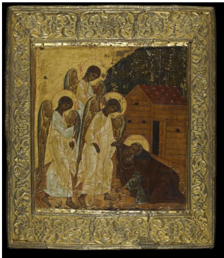
Рис. 4. Явление Святой Троицы преп. Александру Свирскому, вторая четверть – середина XVII в.