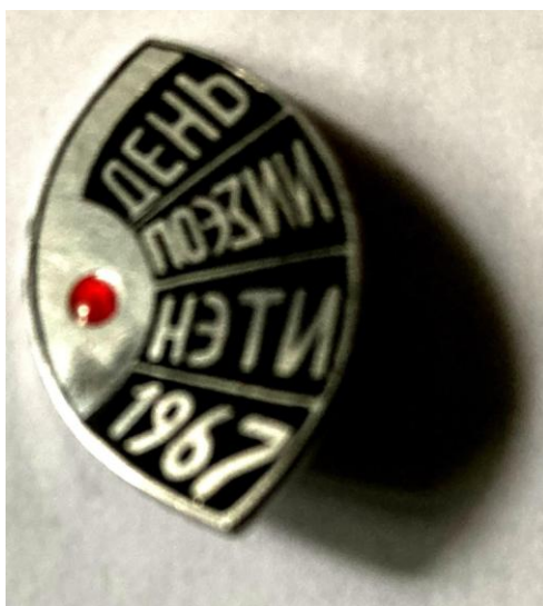
Рис. 1. Значок участника Дня поэзии НЭТИ (современный Новосибирский государственный технический университет – НГТУ) 1967 г.